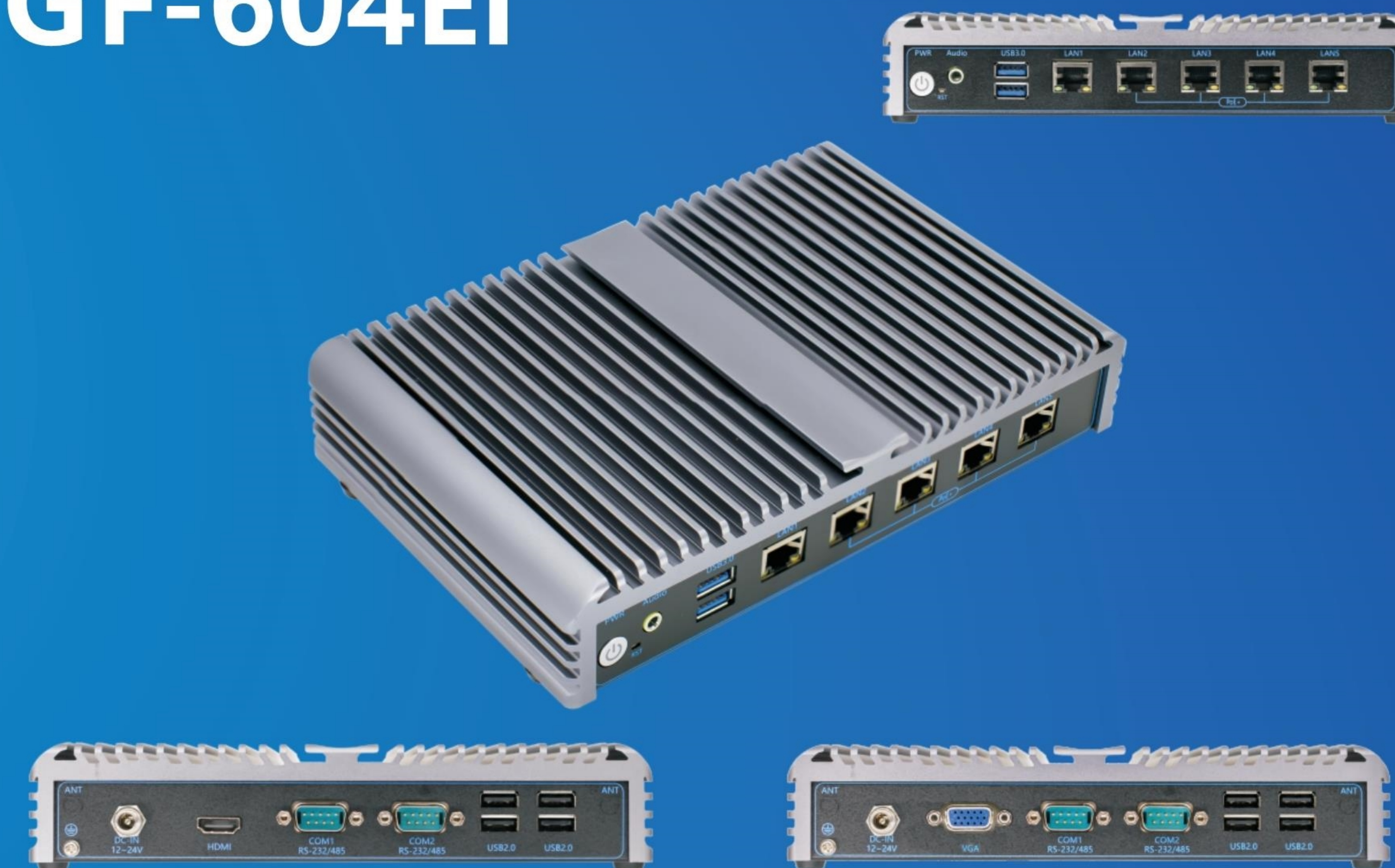
强固型无风扇工控整机